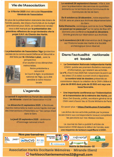
HOM Infolettre 5 1.jpg