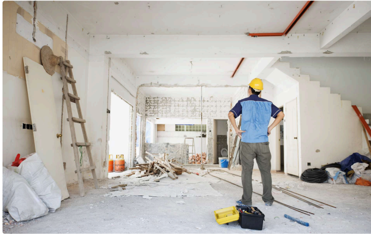
Un guide pratique présentant les dispositifs pour améliorer son logement en Astarac

Les Communautés de Communes Astarac Arros en Gascogne, Cœur d'Astarac en Gascogne et Val de Gers s'associent pour mettre à disposition des habitants un outil simple et complet : le Guide des dispositifs d'amélioration de l'habitat en Astarac .