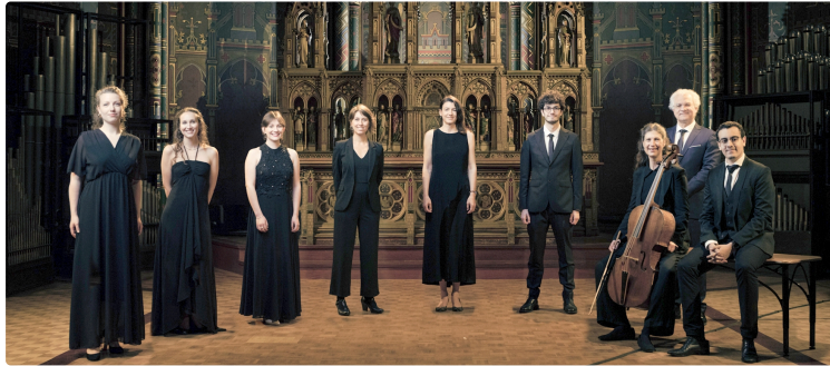
L'Abbaye célèbre la rose en musique

Un concert proposé par Les Musicales des Coteaux de Gimone