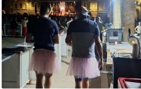
La force d'une municipalité : unir ses associations

Qu'elles soient sportives ou culturelles, elles étaient au nombre de 16 suite au 3 e appel de la mairie pour tenir un stand de restauration et une buvette lors du concert annuel proposé par la mairie.