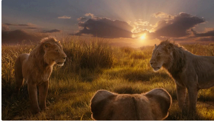
Au cinéma cette semaine, des films pour les plus jeunes et une séance plein air !

Cette semaine, beaucoup de propositions pour le jeune public en cette période de vacances et un ciné plein air !