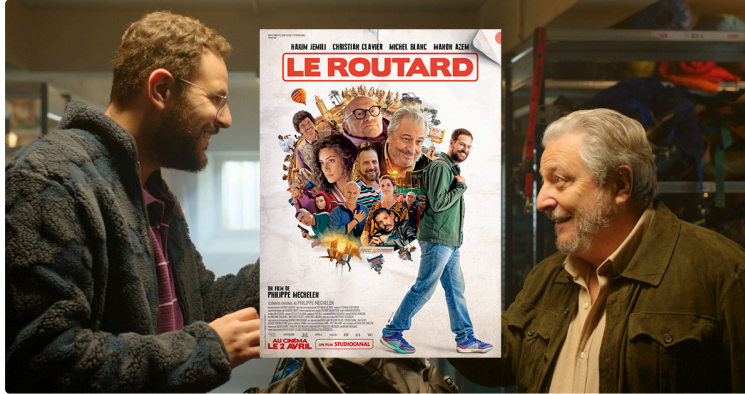
Cinequanon : programme varié et séance de ciné plein air

Encore un grand choix cette semaine avec des propositions variées et une séance de cinéma plein air !