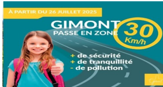
Passé en zone 30

Afin de renforcer la sécurité des voies de circulation pour tous leurs usagers, la ville de Gimont a décidé de mettre en place une zone 30.