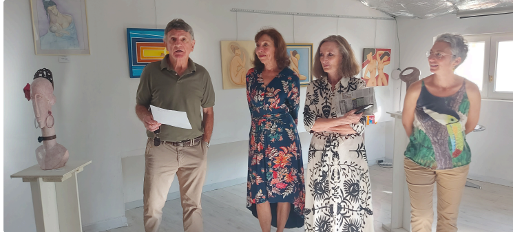
"La féminité", une exposition à découvrir à La Varangue pendant Tempo Latino

Comme chaque année La Varangue ouvre ses portes pendant tout le festival Tempo Latino