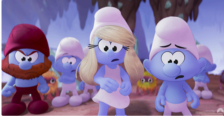
Cinequanon : une large choix cette semaine et une séance spéciale Tempo Latino !

Cette semaine, aventure, animation, drame, thriller, western... Une programmation pour toutes et tous !