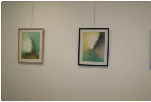
000_0222 - Copie.JPG