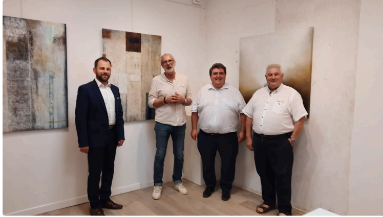
"Un passeur du temps " vernissage de la nouvelle exposition à la galerie "L'Arcade " de l'artiste peintre Marc Courtois.