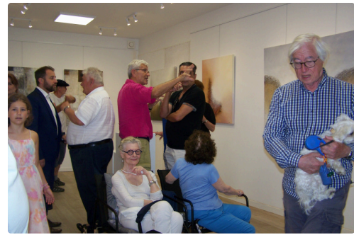
000_0224 - Copie.JPG