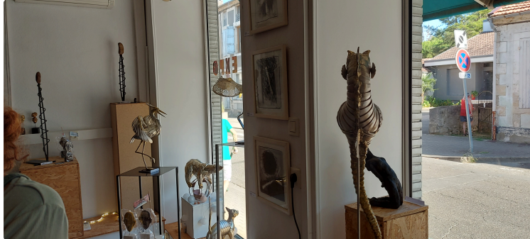
Une nouvelle exposition à découvrir à la Ligne Rouge !