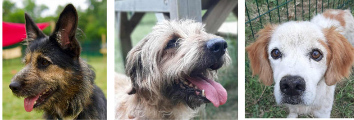
Seiya, Rufus et Junior, les trois nouveaux venus de la semaine !

Cette semaine, la SPA vous présente les trois loulous de la semaine, Seiya et les doyens Rufus et Junior.