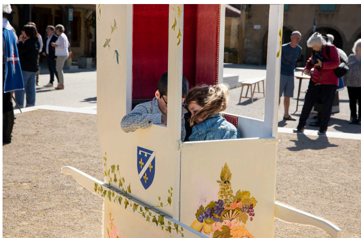
Des enfants se l'approprient

L'épreuve a lieu sur la place de Lupiac : les équipes (2 porteurs par chaise) parcourent 110 mètres le plus vite possible.