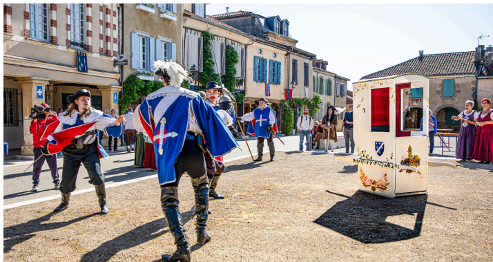
Le même jour, avec Les Lames Lupiacoises