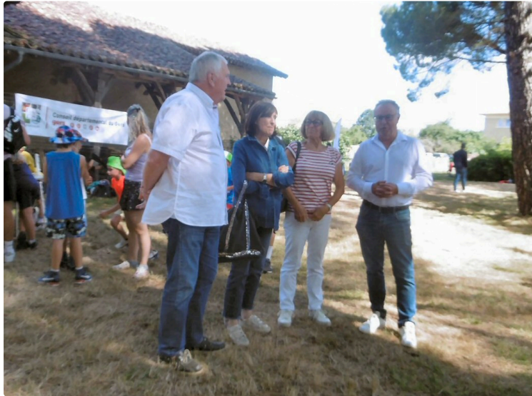
Début des animations " Un été à Masseube" pour découvrir les sports de nature

Dans le cadre du futur Centre départemental des sports de Nature