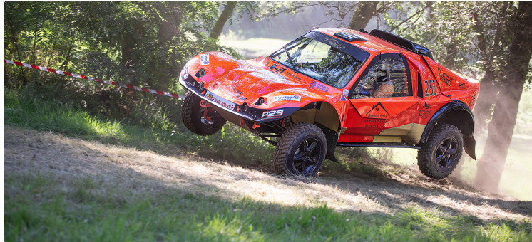
Le plus beau des rallyes tout-terrain : du 11 au 13 juillet autour de Toujouse

Le Rallye Terres d'Armagnac compte pour le Championnat de France