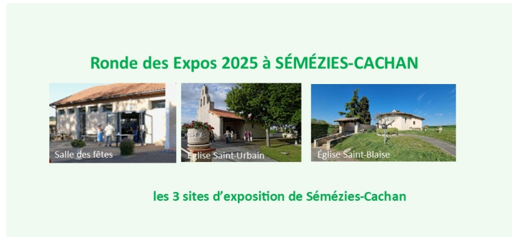
Une des escales de La Ronde des Expos à Sémézies-Cachan

Programme dévoilé pour Sémézies Cachan: un été d'art, d'histoire et de musique à ne pas manquer !