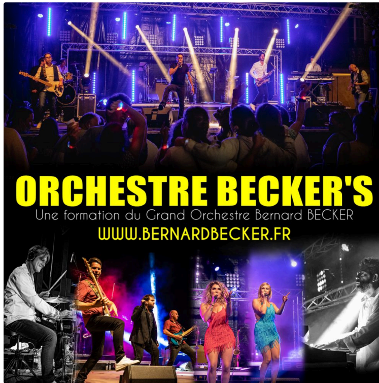
Fête du 1er au 4 août

Quatre jours d'animations et de convivialité