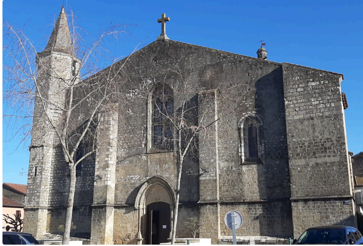
Actualités paroissiales du mois de juillet 2025