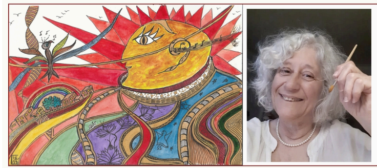
Illustrations joyeuses du samedi 9 au dimanche 17 août

Rencontre avec une artiste dans un univers tendre.