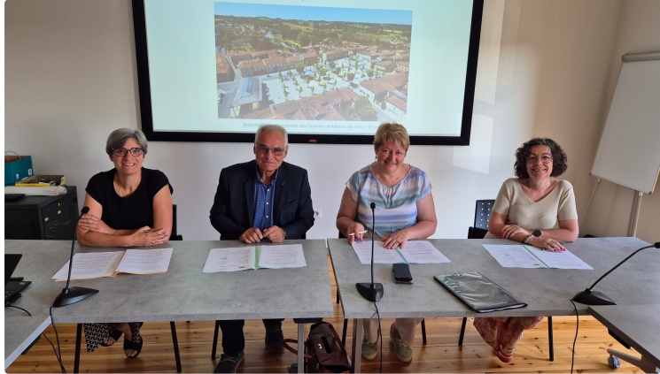
Signature de la charte de recouvrement pour l'EHPAD Val de Gers

Mardi 17 juin 2025 , la Communauté de Communes Val de Gers a franchi une nouvelle étape dans sa démarche de modernisation de la gestion publique en signant, aux côtés de la Direction Départementale des Finances Publiques du Gers (DDFIP 32), une charte de recouvrement destinée à encadrer et améliorer le traitement des recettes de l'EHPAD Val de Gers.