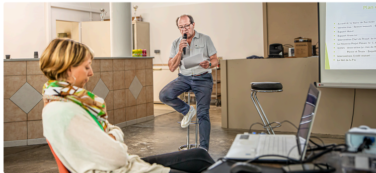
Association Pimao à Perchède : répondre aux questions du quotidien

Par des actions culturelles, sociales et pédagogiques