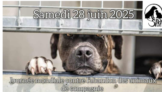
Samedi 28 juin, journée mondiale contre l'abandon des animaux domestiques

En ce 28 juin, journée contre l'abandon, la SPA du Gers lance un cri du coeur.