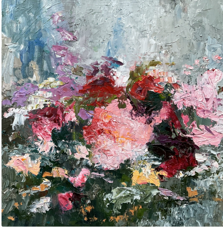
Vineart 2025 : art et vin au Domaine de Polignac avec la Cimaise Armagnacaise