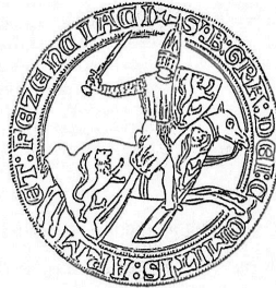
Société Archéologique du Gers, réunion du 2 juillet 2025

La prochaine réunion de la Société archéologique du Gers aura lieu le Mercredi 2 juillet 2025 à 14h 30 au 13 place Salluste du Bartas à Auch.