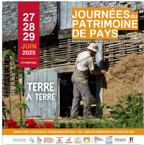
affiche Journée Patrimoine Pays 28-29 juin 2025 copy.jpg