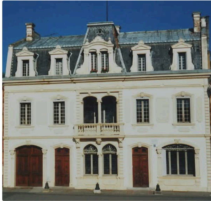
La Maison Claude AUGÉ et ses vitraux: d'inspiration ART NOUVEAU ou ART DECO ?

La maison Claude Augé de l'Isle Jourdain est classée aux monuments historiques de par tous les vitraux d'inspiration "Art Nouveau" que l'on peut découvrir en la visitant. Lors de ces visites, une question revient souvent : quelle est la différence entre L'Art Nouveau et l'Art Déco ?