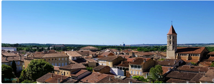
Plan canicule : le CCAS prend soin de vous !

Comme chaque été, la ville de Fleurance met en place son plan canicule afin de protéger les plus fragiles face aux épisodes de grandes chaleurs.