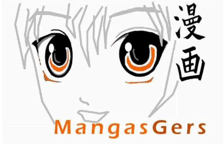
Dans le Gers, le manga devient une aventure collective

MangasGers, la lecture manga comme levier culturel et collectif