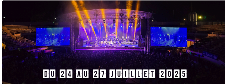
Tempo Latino 2025 côté pratique : venir, se déplacer, dormir

Après le programme, voici venu le temps des informations pratiques !