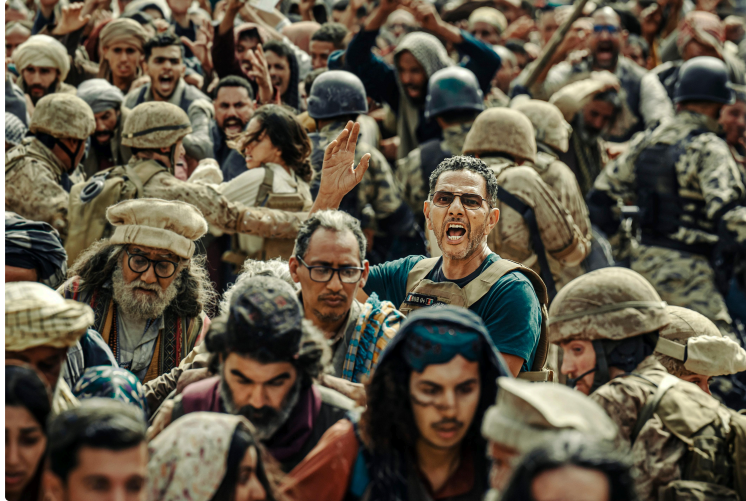
Cine Qua Non : "13 jours 13 nuits" en sortie nationale et le dernier Pixar !

Au programme cette semaine, comédie, action, animation !