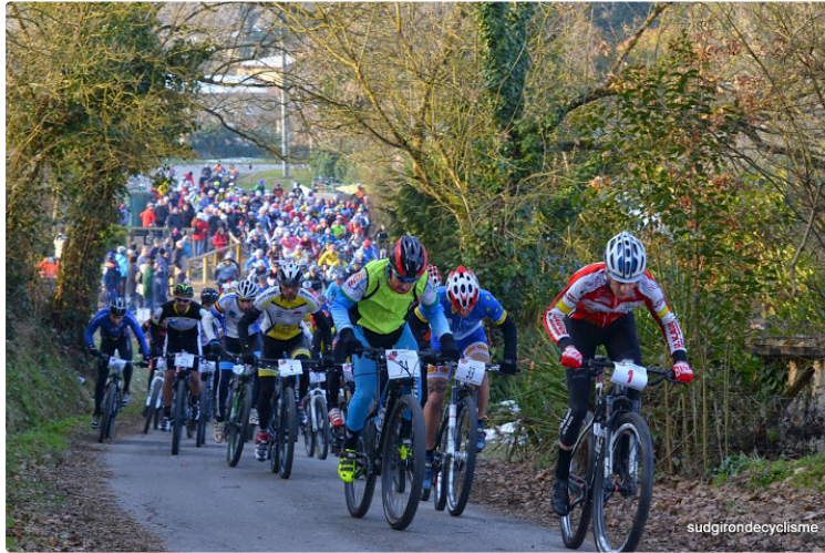
MAUVEZIN - 16ème Edition du Challenge de la Lomagne

Le vélo club Mauvezinois organisa son premier VTT le 22 février 1998 (intitulé la VTT Mauvezinoise) sous forme d'un parcours regroupant quatre circuits différents. Ces circuits sont idéaux pour les débutants, les chevronnés et les amateurs.