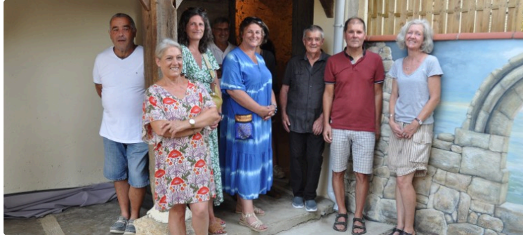
Venez fêter la musique à Mourède avec l'association Amour'Aide !

L'association Amour' Aide vous invite à venir fêter la musique