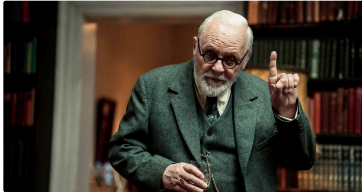
Cine Qua Non : Anthony Hopkins dans "Freud la dernière confession"