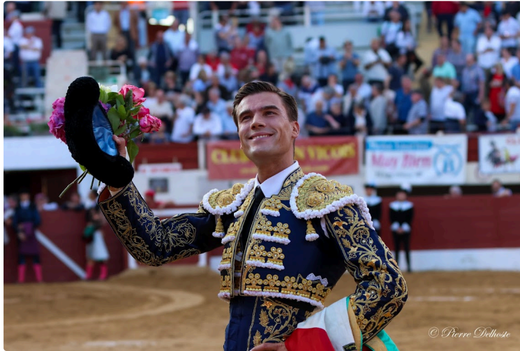
Feria del toro 2025 : retour sur la journée du samedi

Après notre retour-photos sur les festivités de Pentecôtavic, place à la feria del toro 2025.