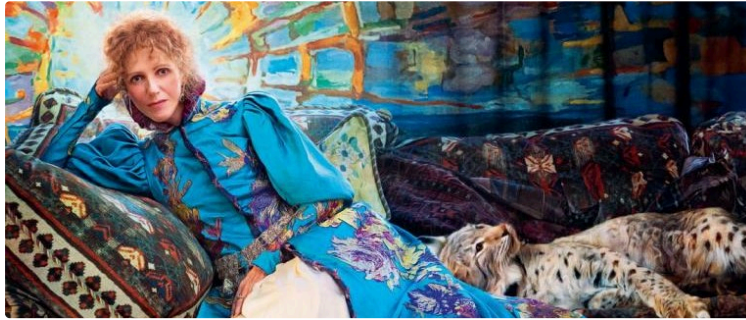
Sarah Bernhardt la divine