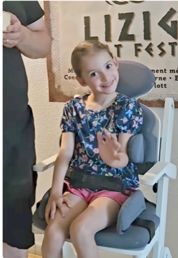
Le Lizig Celt Fest : la nouvelle édition festival celtique 2025 fera danser les cœurs!

Un voyage dans le temps au profit de l'Association Faire Danser Louise