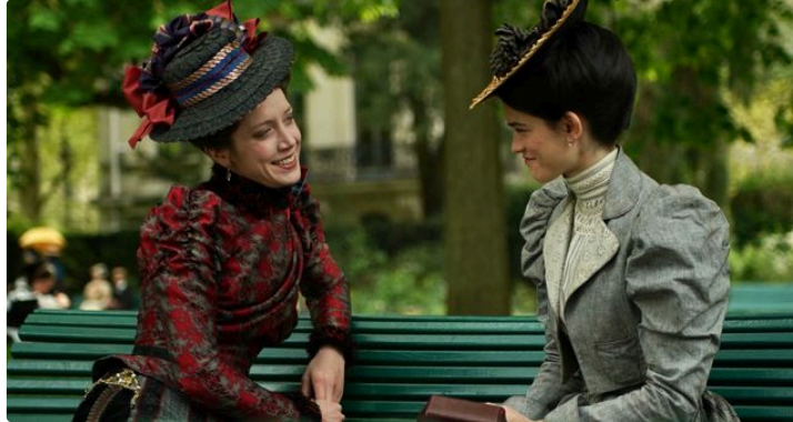
Cine Qua Non : deux films présentés à Cannes cette semaine

Les festivités terminées, retrouvez votre cinéma avec un choix varié cette semaine dont deux films présentés à Cannes.