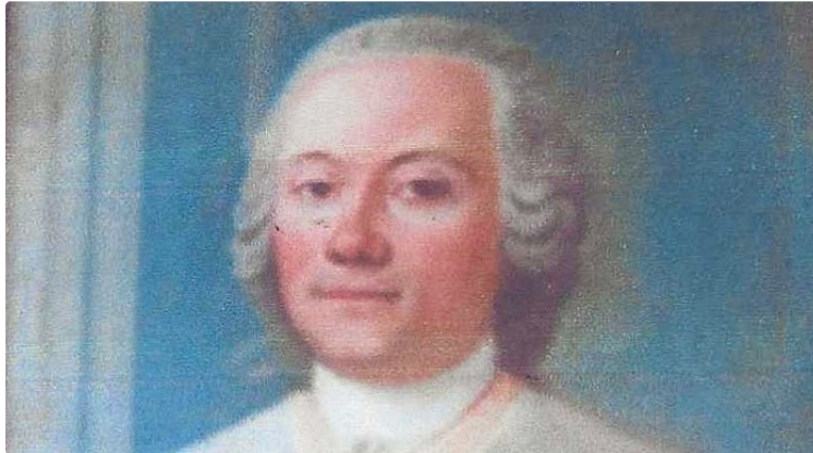
Société Archéologique du Gers, réunion du 4 juin 2025