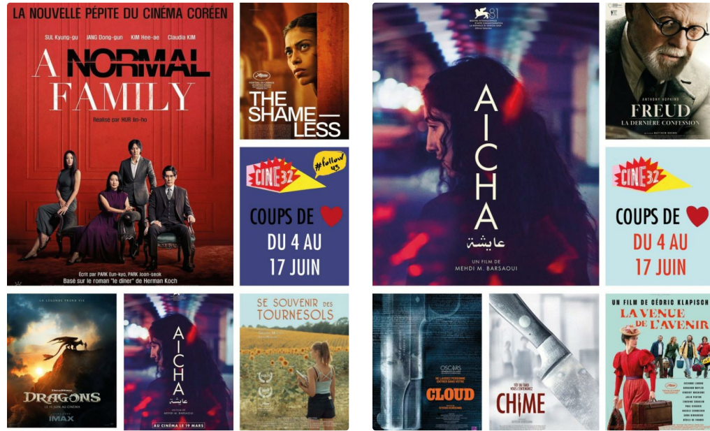
PROG # (1).jpg

La Marche des Fiertés d'Auch viendra se poser sur le parvis de Ciné32, où vous pourrez retrouver un village associatif et des Drag Shows !