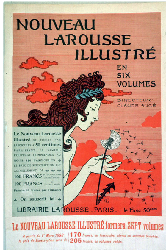
Des nouvelles de Claude Augé : la semeuse nue dite la scandaleuse

Tout le monde connaît la Semeuse, emblème des éditions Larousse, cette jeune femme soufflant sur un pissenlit, qui répand ses graines comme les dictionnaires répandent leur savoir à travers le monde.