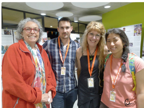
TRAD a 28 5 25.JPG