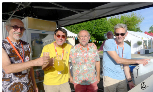
TRAD 1 buvette 28 5 25.JPG

Et en mettant à l'honneur tous les bénévoles, Le Journal Du Gers est un journal exclusivement tenu, lui aussi, par des correspondants de presse bénévoles .