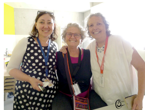
TRAD Accueil 2 28 5 25.JPG