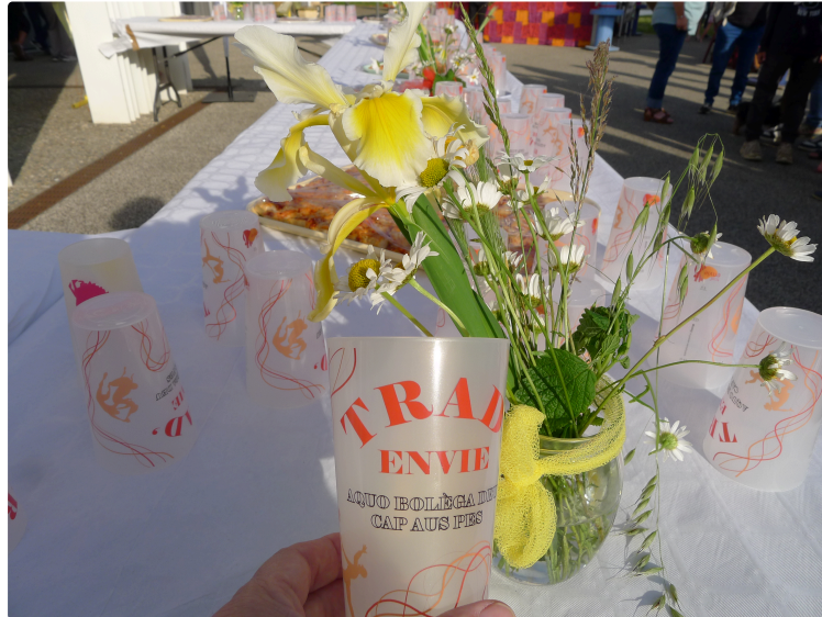
TRAD'ENVIE, la danse au cœur : le festival de musiques traditionnelles enflamme Pavie pour sa 27e édition

Depuis mercredi soir, la commune de Pavie, aux portes d'Auch, vibre au rythme des musiques traditionnelles. Le festival Trad'Envie a lancé sa 27e édition sous un ciel radieux, fidèle à une réputation bien ancrée : celle d'un rendez-vous festif, chaleureux et fédérateur, où les cultures populaires prennent toute leur place.