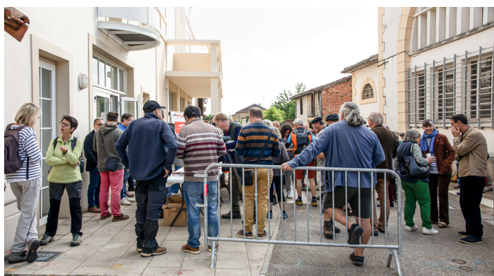
La foule des pèlerins et des randonneurs devant le cinéma de Nogaro

La distance totale à vol d'oiseau entre Le Puy-en-Velay et Saint-Jacques-de-Compostelle est de 1 024 km. Le GR®101 a une longueur totale de 142 km et il y a 110 km de Nogaro à Lourdes. Cet itinéraire connaît une fréquentation croissante, car il permet de rejoindre Lourdes directement depuis Nogaro en 6 étapes. Et de retrouver la Voie du Piémont avec GR 78.