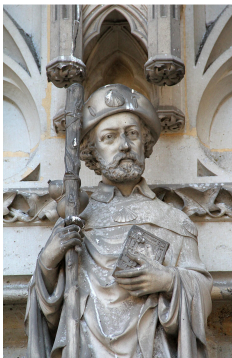
Le pèlerin

pratiquer une activité physique en plein air.