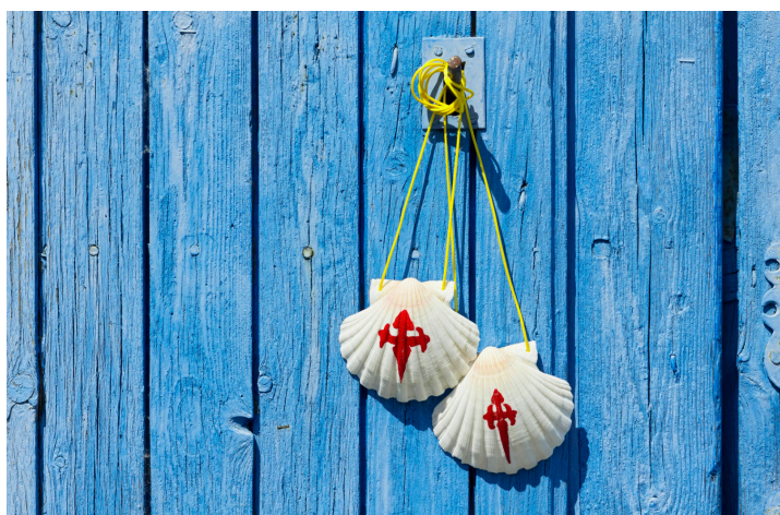
Coquilles Saint-Jacques