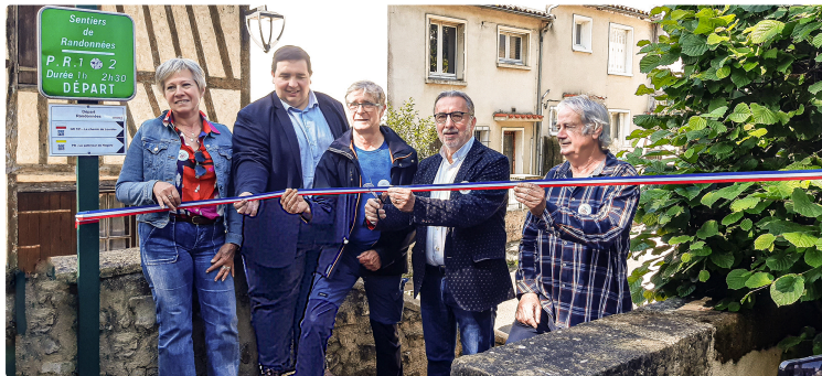
À Nogaro, les pèlerins ont à présent une bifurcation vers Lourdes

Les collectivités publiques et les organisations de tourisme (1) ont réalisé le vœu de nombreux pèlerins et randonneurs : créer une bifurcation qui mène à Lourdes, dans le Chemin du Puy, et le connecte aux deux autres itinéraires du Chemin de Saint-Jacques-de-Compostelle (le Chemin d'Arles et la Voie du Piémont). C'est une prolongation du GR®101, appelée Chemin de Lourdes.