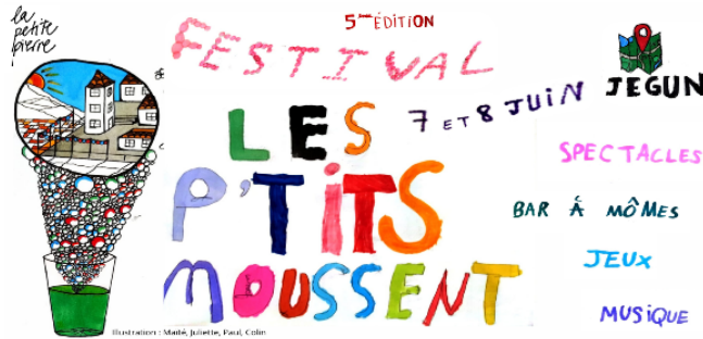
Festival Les P'tits Moussent, 5e édition : demandez le programme !

Voici venu le temps du festival Les P'tits Moussent, 5e édition, un festival organisé par des familles, pour des familles samedi 7 et dimanche 8 juin