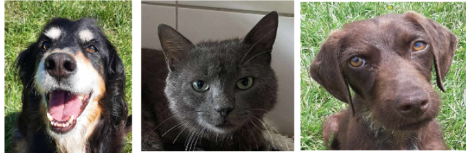
A la une, Shorty le doyen, la toute jeune Mirabelle et Boris le matou !

Cette semaine, la SPA vous présente Shorty, un doyen, Mirabelle, une jeune chienne et Boris le matou.