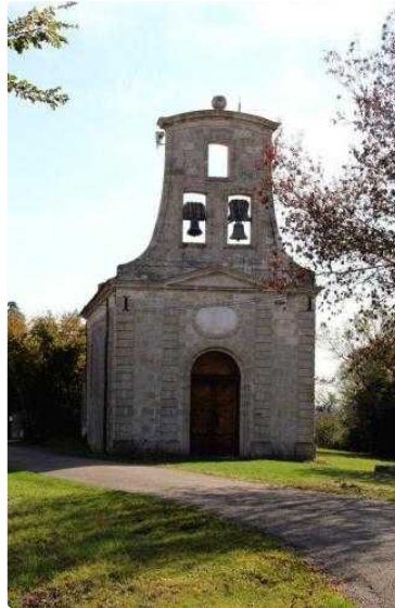
Journées du Patrimoine de Pays : la chapelle de Saint Martin de las Oumettes se révèle

Pour la 27 ème édition des Journées du Patrimoine de Pays la chapelle Saint Martin de las Oumettes située sur la commune de Mauroux (32380) sur la route D13 menant au Casteron