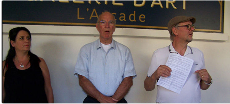
Deux artistes exposent à la galerie " L'Arcade ", ils sont les explorateurs des jeux du regard et de la lumière.