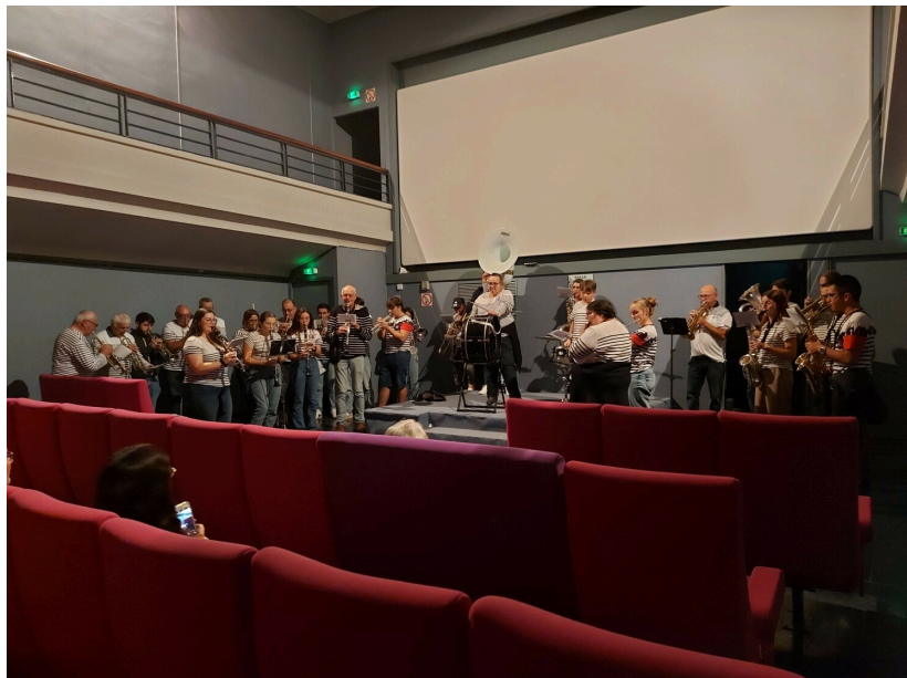
L'Harmonie vicoise au cinéma