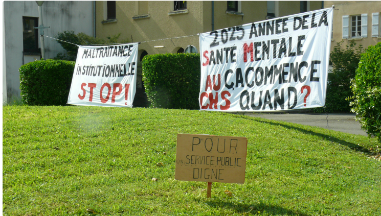
Hôpital psychiatrique : le conflit se durcit entre direction et les grévistes

Ce jeudi 15 mai, ce sont plus de 60 manifestants qui sont allés à la rencontre de l'équipe de direction, une mobilisation qui enfle de jour en jour.