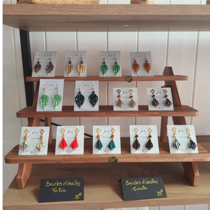
Surprendre votre maman avec un cadeau unique

Envie de surprendre votre maman avec un cadeau unique, fait avec amour et 100% local ?