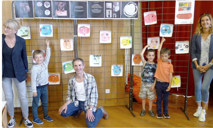
Des regards multifacettes dans des boîtes.